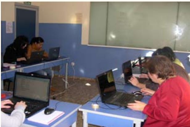
AULA CEDIDA POR ACADEMIA FORACCI (C/ SAN MIGUEL)